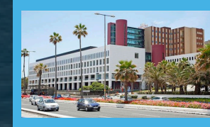
El hospital al que H2Heat suministrará electricidad y climatización.